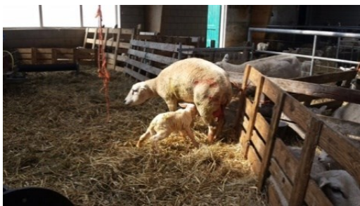
Bij de boer

We hebben aandacht voor buiten-leren. We wekken bij de kinderen belangstelling voor de natuur...In de lessen wordt gebruik gemaakt van biologiebakken van "Groen Doen" uit Oudemirdum en van projecten die door onze eigen leerkrachten zijn ontwikkeld. De kinderen zijn dan in groepjes bezig en voeren diverse proefjes uit. Kortom, zij zijn zelf actief. We gebruiken Zaken van Zwijsen. Groep 6 werkt in de dorpstuin en alle groepen hebben een eigen plantenbak aan de zijkant van de school. In de lagere leerjaren wordt veel materiaal gebruikt dat bij televisielessen hoort.