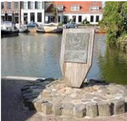
De tekst op de gedenkplaat luidt: