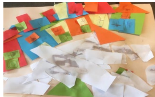
Kunstwerken van groep 1 Groep 1 en 2 werken met de kleutermethode "Onderbouw"...

En ook: We houden dit samen nog wel even vol. Daarbij geldt vooral: wees lief voor elkaar en pas een beetje op elkaar.